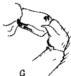
F. Pandisus scalaris E. Sim. Yeux en dessus. — G. Idem . Patella et tibia de la p.-su. ♂ par la face externe. [Simon, E. 1901. Histoire naturelle des araignées. Paris, 2: 391].

(1) Voir pour les mémoires 1 à 29, nos I à XLVI, Annales de 1873 à 1897.